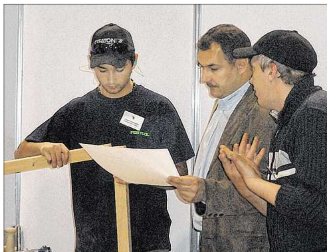
A szaktudás megszerzését több – főleg gyakorlati – órához kötik

Megváltozik, hogy mely szakmák oktathatók kizárólag iskolai rendszerben, illetve iskolarendszeren kívül. A rendeletben szereplő szakképesítések 2012. szeptember 1-jétől – amennyiben a kapcsolódó szakmai és vizsgakövetelmények megjelennék – már indíthatóak iskolarendszerű képzésben.